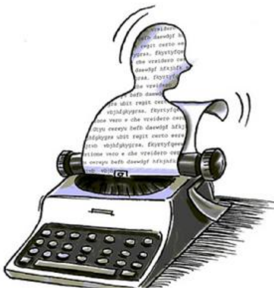
Immagine di Pierluigi Balducci per il libro "Scrivere di sé" ed. Sonda