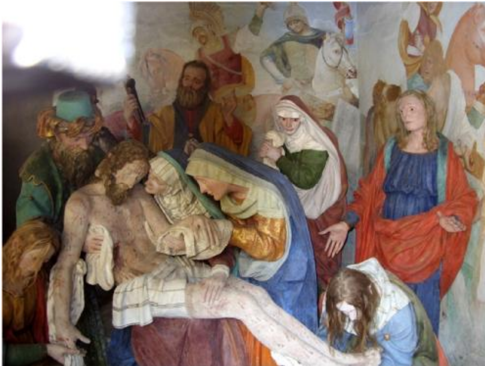
Cappella 40 – La Pietà – Statue ed affreschi di Giovanni d’Ernico (1635 circa)