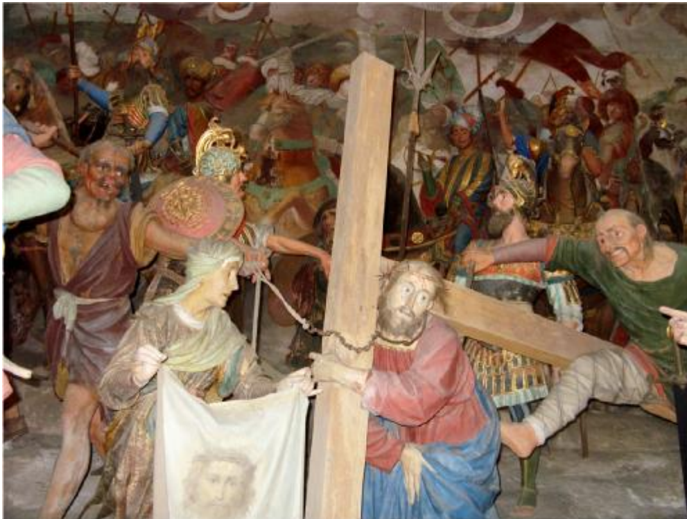
Cappella 36 – Salita al Calvario – 50 statue e 14 animali in terracotta policroma opera dello scultore fiammingo Jean de Wespen detto il Tabacchetti. Gli affreschi sono opera di Pier Francesco Mazzucchelli detto il Morazzone.

Il complesso del Sacro Monte di Varallo, insieme agli altri otto Sacri Monti del Piemonte e della Lombardia è stato incluso dall' Unesco nella lista del Patrimonio Mondiale.