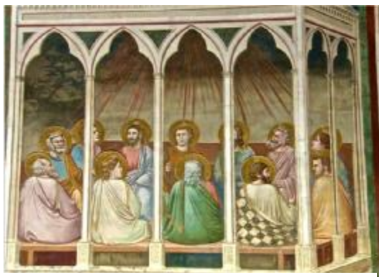
Giotto – Cappella degli Scrovegni

Come sarebbe bello se, con le persone che ci stanno accanto, ci si potesse esprimere e, allo stesso tempo, intendere sempre con facilità e semplicità! Credo che questa sia esperienza di tutti, compresi quelli che, pur non esprimendosi bene con la parola, hanno, tuttavia, qualcosa di bello dentro da trasmettere e render "comune" agli altri, specialmente a chi si vuole bene. La parola deriva dal latino communicare che, fin dal medioevo, riveste, appunto il