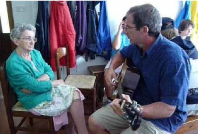
Luglio 2009 (Vermiglio)