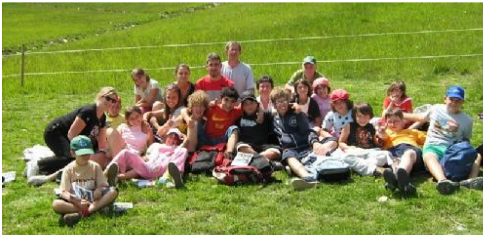
Luglio 2009 (Vermiglio)