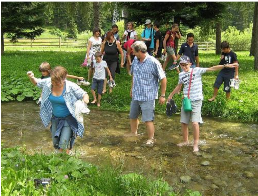
Attraversamento di un ruscello a Vermiglio, campo-scuola 2013

Basta poco! Basta veramente poco! Per che cosa? Per voler bene a qualcuno. Notare che l'acqua è bisogno primario di base, si diceva, e si dà. Che sia data anche fresca, ci dice il Signore, è segno di attenzione umile e bellissima all'altro. Un di più che rende gioioso l'altro che riceve. Si è già detto del clima caldo della terra percorsa da Gesù. Sapeva bene cosa diceva ai suoi! Forse capita di voler e dover realizzare progetti grandiosi o avere una lista di tante cose da fare, materiali e necessarie. Prima di tutto, c'insegna Cristo e la sua amata Chiesa, avere sempre l'umiltà di non dimenticare di chi è più piccolo cui dare, con sensibilità e rispetto, il bicchiere d'acqua fresca per la sua necessità, quella di un piccolo che non osa dire quale sia per vergogna. Perché è un discepolo di Gesù, un suo familiare. Uno che lo segue. I cristiani, la domenica, sanno dove andare a bere l'acqua fresca, perché discepoli.