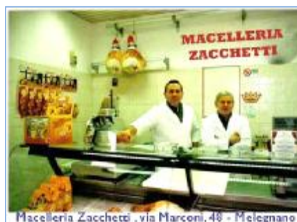
Macelleria Zacchetti, via Marconi, 49 - Melegnano